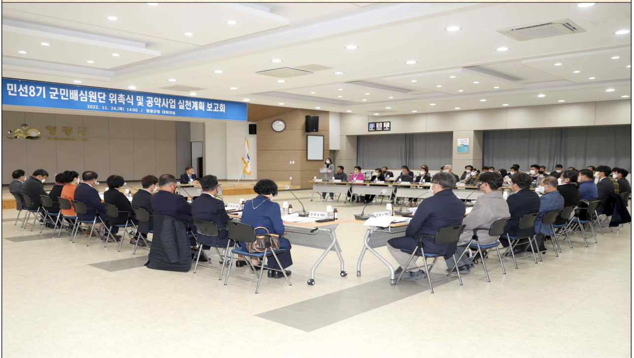
민선8기 군민배심원단 위촉식 및 공약사업 실천계획 보고회