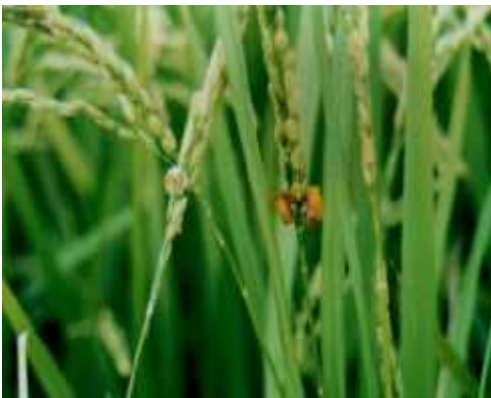
【이삭누룩병 초기 증상】

⇒ 발병된 논에서는 피해 받은 이삭은 뽑아 버리고, 수확된 볍씨는 가급적 종자로 사용하지 말아야 하고, 발생이 심한 논에는 다음해에 저항성 품종을 재배하여 발생을 줄여야 함