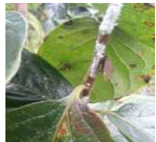
【갈색날개매미충 및 감나무 산란】