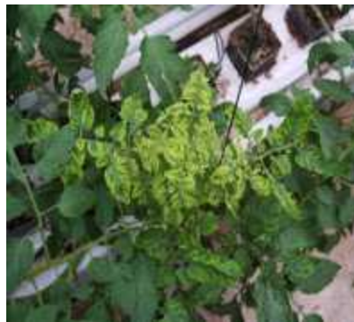
【토마토 TYLCV 증상】