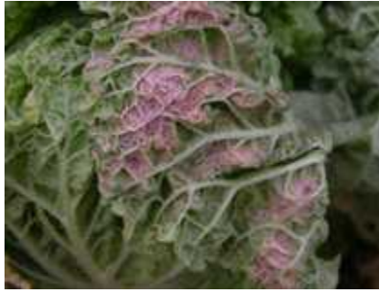
【배추 노균병 증상】