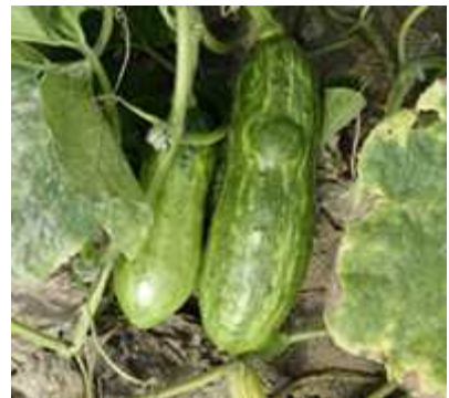
【호박 ZYMV 증상】