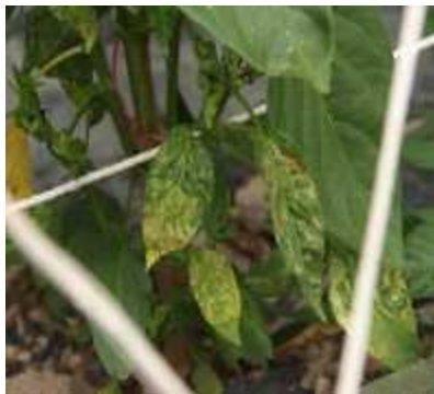
【고추 TSWV 증상】

⇒ 진딧물 방제를 철저히 하고 작물이 시설 내에 연중 재배되어 항상 전염원은 있으므로 즙액에 의한 접촉전염을 막기 위해 병든 식물체는 즉시 제거