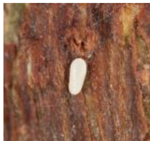
【미국선녀벌레 성충 및 알】