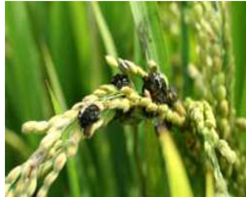
【이삭누룩병 후기 증상】